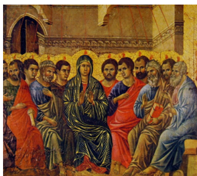
"La Pentecoste" tempera su tavola, Duccio di Buoninsegna, 1308-11, Museo dell'Opera del Duomo di Siena