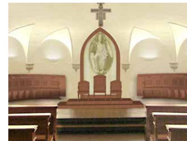
FOTO DELLO STATO DI FATTO E FOTOMONTAGGIO DELLA NUOVA SEDE E VETRATA ARTISTICA