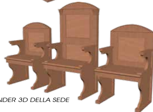
RENDER 3D DELLA SEDE