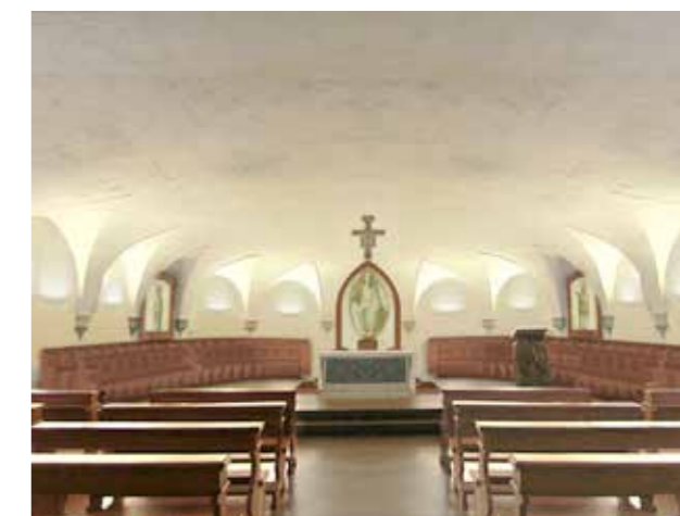
FOTO DELLO STATO DI FATTO E FOTOMONTAGGIO CON INSERIMENTO DELLE NUOVE OPERE VISTA GENERALE DELLA CRIPTA