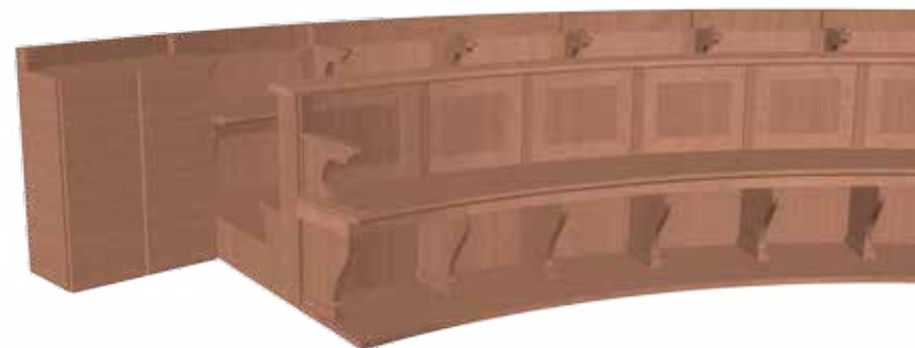
PARTICOLARE DEL CORO