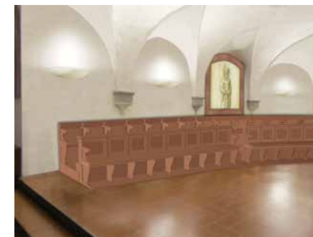
FOTO DELLO STATO DI FATTO E FOTOMONTAGGIO DEL CORO - PARTICOLARE